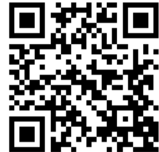
Рис. 1 - Пример QR-кода

QR-код (quick response) - это новый вид штрих-кода, в котором кодируется разная информация (адреса, номера и т.д.). Его используют для компактного кодирования определенной информации, которую можно быстро считать с помощью специальных сканеров (см. рис. 1).